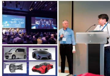
3DEXPERIENCE Edu Summit2024などの講演

国内に限らず海外まで視野を広げた人材育成を目指し、2019年に、当時世界で16校目のLabとして「ASO Learning Lab」を設立。多くの学生が作品を海外に発信し、国際コンペティションでも高評価を受けています。自ら考え、取り組む「挑戦」を通して、高みを目指してほしいです。